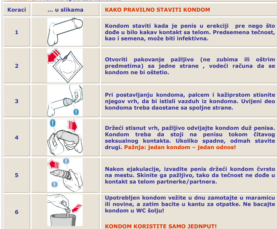
TABELA 5: Pravilna upotreba kondoma